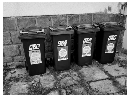
I VE SPORTOVNÍM AREÁLU TRÍDÍME