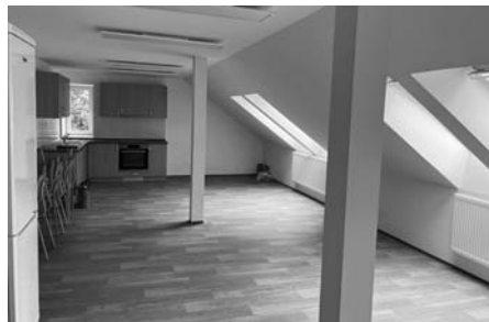
SKAUTSKÁ KLUBOVNA PO KOLAUDACI