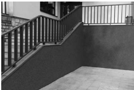
OPRAVENÉ SCHODIŠTĚ DO TĚLOCVIČNY