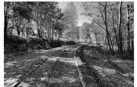
CYKLOSTEZKA DO SVRATOUCHU