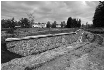
ČÁST OBTOKOVÉHO KORYTA A ZPEVNĚNÍ HRÁZE