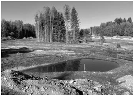
TŮŇ VEDLE RYBNÍKA SVRATKA

„Manželé se v autobuse poznají podle toho, že na sebe nemluví.“ (Jan Werich)