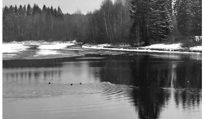
RYBNÍK SVRATKA TĚSNĚ PŘED VÝLOVEM, CO SE UKRYVALO POD JEHO HLADINOU, DNES UŽ VÍME

Investiční záměr pro akci „Stavební úpravy bytové jednotky v podkroví ZŠ a MŠ“ . Na Zastupitelstvu města Svratky, konaného dne 8. 4. 2021, jsme si tento záměr schválili... ☺ Dále jsme si schválili podání žádosti o dotaci na stavební úpravy bytové jednotky ZŠ a MŠ Svratka z Výzvy VPS – 223 – 3 – 2021 Ministerstva financí k předložení žádosti o dotaci v roce 2021 z podprogramu 298D2230 – Podpora výstavby a obnovy komunální infrastruktury. Tato dotace je určena na opravy či modernizace bytových objektů, či bytů v majetku žadatele, které slouží nebo budou sloužit k nájemnímu bydlení občanů, dále na pořízení obecních bytů formou investiční výstavby, přístavby resp. nástavby. Náš schválený Investiční záměr se týká právě komplexní opravy zdevastovaného bytu, který se nachází v podkroví ZŠ nad stávajícími dvěma bytovými jednotkami při vjezdu do areálu školy. Pokud dojde k realizaci, touto přestavbou vznikne krásný byt