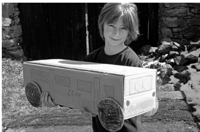
Autobus Filipka B.1