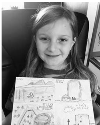
Pozdrav od Nelinky