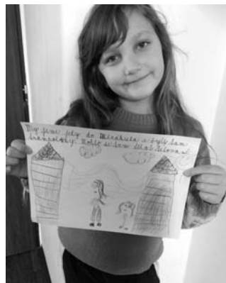
Pozdrav z Mirákula

Prerušeni provozu naší mateřské školy jsme využili k dlouho odkládanému úklidu půdních prostor, třídění hraček a celkové renovaci vnitřních prostor MŠ. Načerpané síly tak byly využity ke tvoření hezčího prostředí pro naše malé návštěvníky.