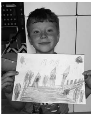
Martinkův Pražský hrad