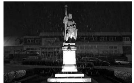
SVATÝ VÁCLAV SE ROZZÁŘIL