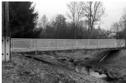
LÁVKA NA MORAVU I DO ČECH