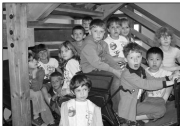
ZŠ výlet 1. třída

formou. Kostýmem se pro tento den stalo pyžamo. Hned ranní program začal poněkud netradičně a to rozcvičkou na zahradě školy. Provozní zaměstnanci i paní kuchařky s námi „táhli za jeden provaz“ a opravdu naruby nám připravili svačinku - menší děti našly svůj chleba na obráceném talíři a děti větší si v tento den namazaly pomazánku na chleba samy. Program nadále pokračoval na zahradě školy, kde proběhlo několik soutěží. Slalom mezi kužely, prolézání pod provazem, věšení kuliček a soutěž, kdy si děti oblékaly věci, co nejrychleji uměly. Ke dni dětí patří i okamžiky, které děti jen tak ve školce neprožijí, proto jsme se společně vydali na zmrzlinu. Poté nás ve školce ještě čekal oběd, kde jsme prvně jedly hlavní chod- lžící a na závěr polévku vidličkou. Celý den jsme si náramně užili, prožili jsme kopec srandy a vyzkoušeli zase něco nového!