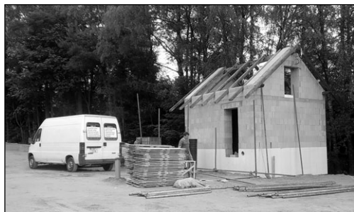
BUDUJE SE ATS... SLUNNÝ VRCH...