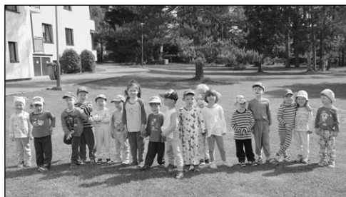
Den dětí v MŠ