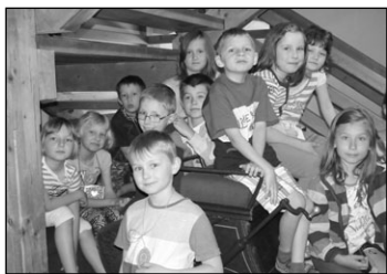
ZŠ výlet 2. třída