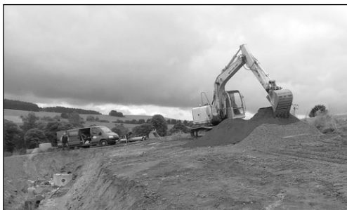
BAGRY BAGRUJÍ KAŽDÝ DEN...