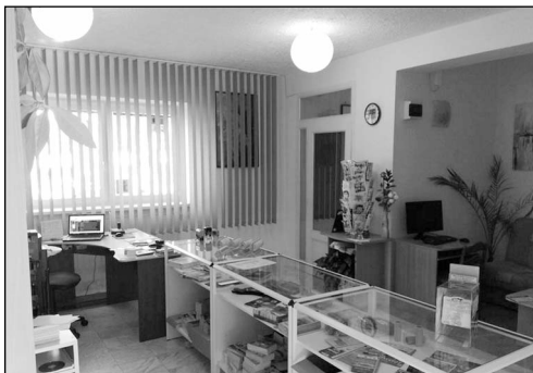
INFORMAČNÍ CENTRUM V NOVÝCH PROSTORÁCH RADNICE

Pod svatým Václavem je živo. Zemní práce jsou v plném proudu. Do konce dubna by měla být v celé ploše 500 m 2 položena namísto litého asfaltu, žulová dlažba. Současně bude opraven a vydlážděn chodník v ulici Partyzánská v délce 120 metrů o ploše 240 m 2 , od Krušovické restaurace směrem ke škole, na konec oplocení nemovitosti Teplých. Druhá etapa dodláždění až na křižovatku ke vjezdu do areálu školy, proběhne v roce příštím. Na tuto opravu bude