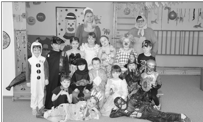
Karneval v MŠ