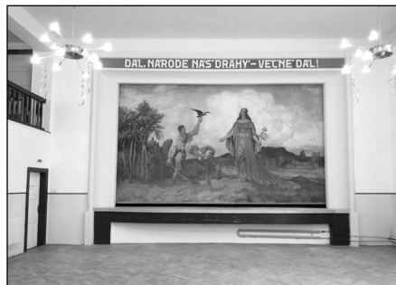
ODHALENÝ NERUDŮV ODKAZ SE OPĚT PO 60 LETECH LETECH SNOUBÍ S OPONU