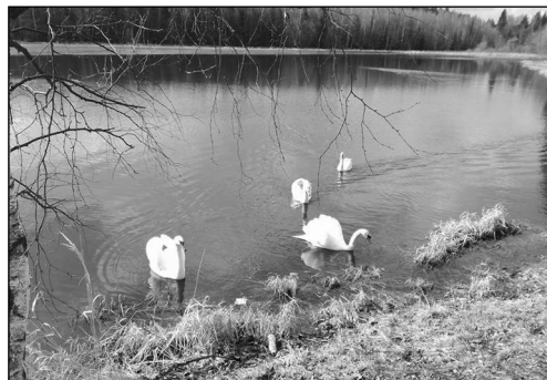
JARO VE SVRATCE

Technické služby města jsou ve fázi stěhování. Termín akce „kulový blesk“ by měl být dokončen nejpozději do 30. 4. 2017. Není opravdu jednoduché se po tolika letech stěhovat. Tato radikální změna přišla opravdu téměř po 40 letech. Věřme však všichni, že dnešní historické stěhování včetně sběrného dvora je dobrým a tím nejsprávnějším rozhodnutím pro další budoucnost i rozvoj našeho městečka. Naše „Rychlá rota“ si po letech strávených v dosti neúctných podmínkách, zaslouží určitě důstojné zázemí, které si pomáhala takřka rok budovat. Chtěl bych tímto všem zaměstnancům TESS, ale i pracovníkům z Úřadu práce velmi podě-