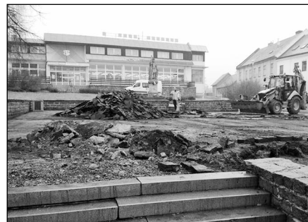
U SVATÉHO VÁCLAVA JE RUŠNO