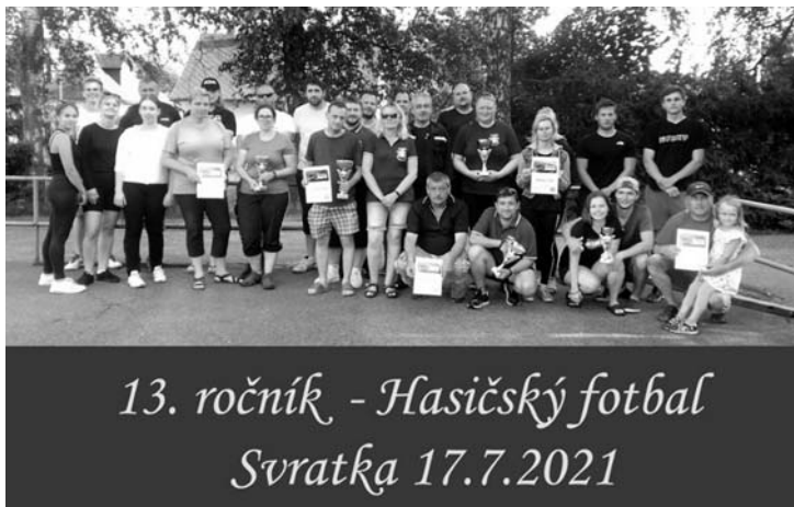
13. ročník - Hasičský fotbal Svratka 17.7.2021