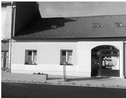
NOVÝ CHODNÍK V ULICI LIBUŠINA

„Přítel je ten, kdo o vás ví všechno a má vás pořád stejně rád.“ ☺ (Elbert Hubbard)