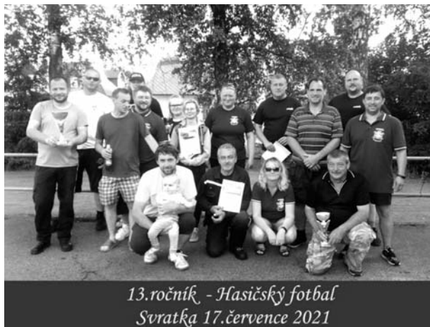
13.ročník - Hasičský fotbal Svratka 17.července 2021

Výsledky ženy: 1.místo: Svratka, 2.místo: Ždírec nad Doubravou | Výsledky muži: 1.místo: Svratka ml, 2.místo: Svratka st., 3.místo: Věcov