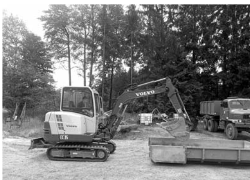
NAŠ NOVÝ POMOCNÍK BAGŘÍK LOJZA