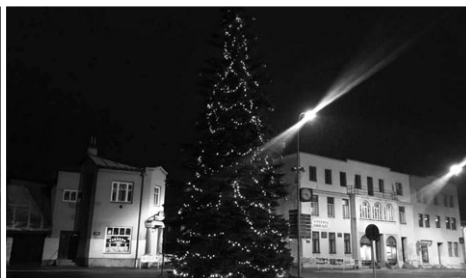
VÁNOČNÍ STROM NA SVATOVÁCLAVSKÉM NÁMĚSTÍ