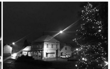
VÁNOČNÍ STROM PŘED RADNICÍ