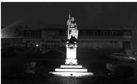
SVATÝ VÁCLAV NÁM STŘEŽÍ NÁMĚSTÍ