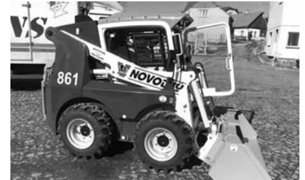
NOVÝ POMOCNÍK TESS

činí 289.875,- Kč včetně DPH. Z toho cca 200.000,- Kč by měla pokrýt případně získaná dotace. Poděkujeme zatím firmě Machač za bezplatné zpracování projektové dokumentace... ☺