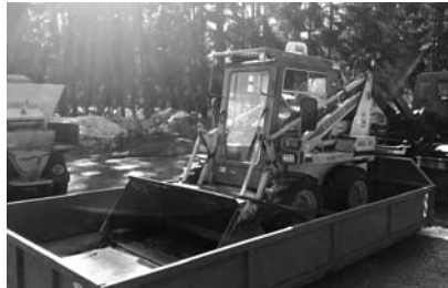
PO 23 LETECH VĚRNÉ SLUŽBY, NASTALO LOUČENÍ

Závlahy Machač. Tato firma nám zpracovala a předložila projekt na zavlažování našeho hlavního fotbalového hřiště. Projekt šitý na míru řeší čerpací a filtrační stanici, vybudování hlavního závlahového řádu, distribuční rozvod vody včetně ventilů a automatické programové řízení závlahy včetně srážkového čidla. Během dvou posledních let firma Machač zrealizovala automatickou závlahu na 50 hřištích a v minulosti na dalších cca 100 hracích plochách. Rozpočet na tuto akci