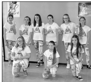
Taneční soutěž starší žákyně