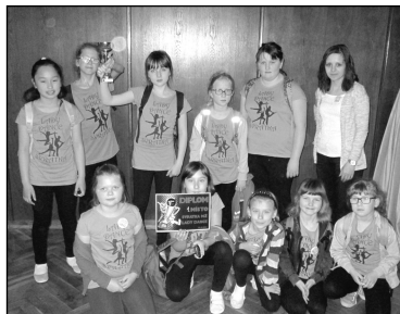
Taneční soutěž mladší žákyně