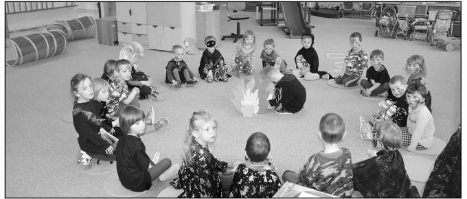
Rej čarodějek v MŠ

minku poznat se zavázanýma očima dle hmatu. Nesměla chybět mašinka, která nás provedla celou naší MŠ. Tanec s míčkem zvládli všichni skvěle. Maminkám poté byla dopřána masáž, kterou jim prováděly jejich vlastní děti. Nakonec došlo i na rozdávání přáníček a drobných dáreků. Myslim, že se celé dopoledne krásně vyvedlo. Děkuji všem zúčastněným za vzorné zapojení a spolupráci při plnění aktivit. Za MŠ J. Širová