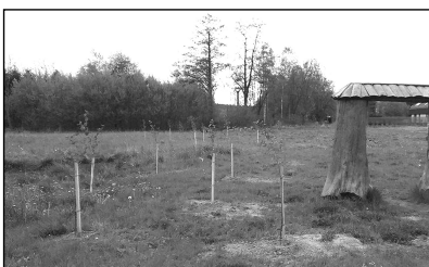
VÝSADBA V PŘÍRODNÍ ZAHRADĚ SVRATKA