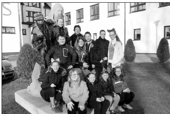
Noc ve škole