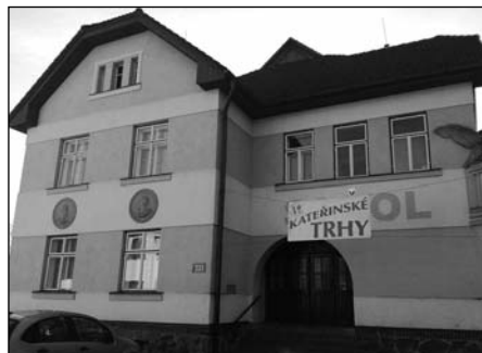
KATEŘINSKÉ TRHY SE PAVEDLY