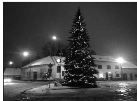
ŠTĚSTNÉ A VESELÉ