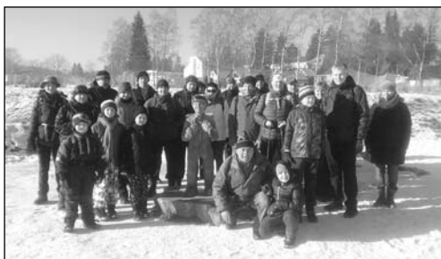
ZASTÁVKA U MALÉHO BOBŠE