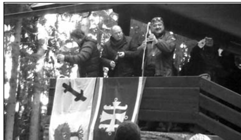
NOVOROČNÍ PŘÍPITEK NA DEVÍTCE

du maximálně připraveni, ale přesto se nám někdy nepodaří být všude včas a v tu pravou chvíli. Zaměstnáváme ještě čtyři muže a dvě ženy z Úřadu práce, kteří doplňují našich pět zaměstnanců z TESS. Všem bych chtěl tímto poděkovat za jejich skvělou práci a nasazení. Vím, že dělají vše pro to, abyste byli spokojeni.