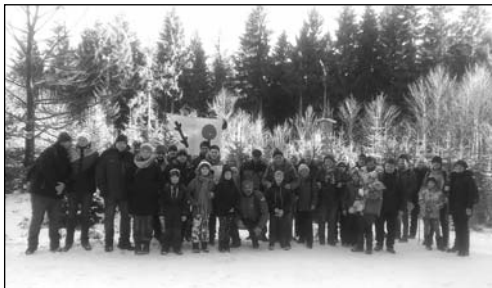
CESTOU K VRCHOLU

Paní Zima se představila v celé své kráse. A co na to lednové pranostiky? „V lednu silný led – v květnu bujný květ“, anebo - „Lednový mráz i železo rozdrtí a ptáka v letu usmrtí“. Je fakt, že takovou „krásnou“ zimu nepamatujeme minimálně sedm let. Když už takhle zima udeřila, chtěl bych Vás poprosit o teplost, pochopení a někdy i o Vaši pomoc a podporu při odklizení sněhové nadílky. V současné době jsme již dobře vyzbrojeni. Máme traktor s přední i zadní radlicí, červený malotraktorek s přední radlicí a zadním posypem, sněhovou frézu, bagrřik UNC, posyp na Multikáře, hrabla a lopaty... ☺ Na letošní zimu jsme oprav-