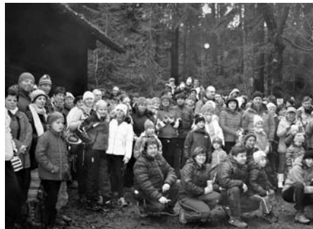
SPOLEČNÉ PŘIVÍTÁNÍ NOVÉHO ROKU NA DEVÍTCE