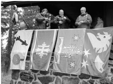
NOVOROČNÍ SETKÁNÍ NA DEVÍTCE