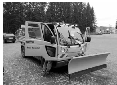
NOVÝ PŘÍRŮSTEK V NAŠEM AUTOPARKU TESS