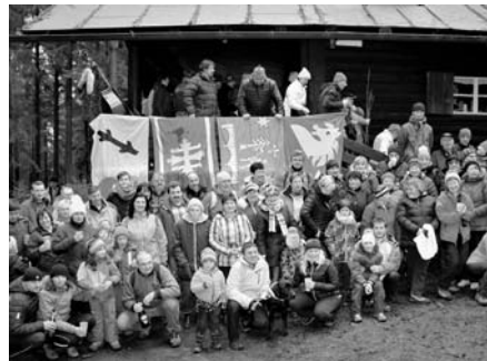
SVRATKA NA DEVÍTCE